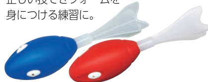
B-2710 PUロケットTL1(青) U-7028 PUロケットTL1(赤) ¥3,300 (税別¥3,000)