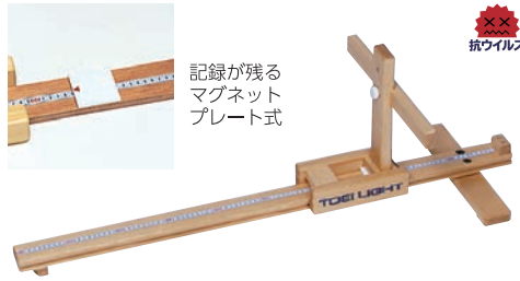
T-2233 長座体前屈測定器2 ¥15,730 (税別¥14,300)