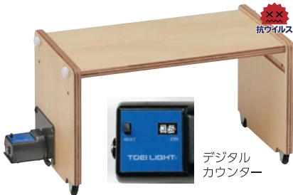
T-1817 長座体前屈測定器5 ¥34,870 (税別¥31,700)