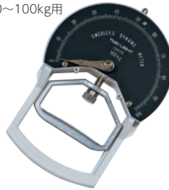
T-1781 握力計ST3 ¥12,100 (税別¥11,000)