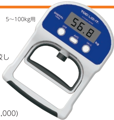
T-1854 デジタル握力計TL2 ¥24,200 (税別¥22,000)