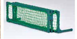
3分割折りたたみコンパクト収納